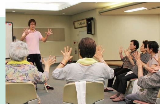
介護予防の体操指導で、地域の健康づくりに貢献しています。