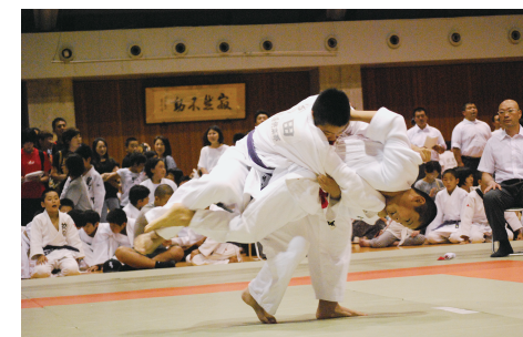
毎年、県下少年柔道大会を開催しています。