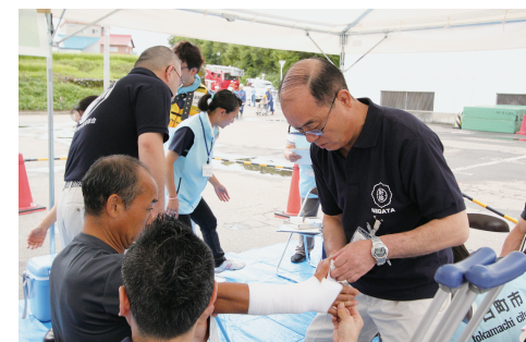
新潟県防災訓練に参加しています。