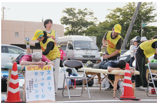
各スポーツの救護ボランティアに参加しています。