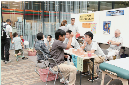
地域の健康増進のイベントに参加しています。